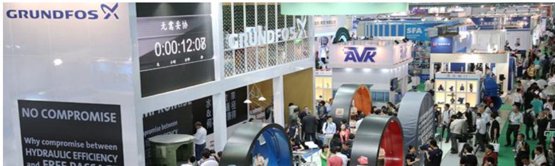
写真：2013 中国（上海）国際環境博覧会